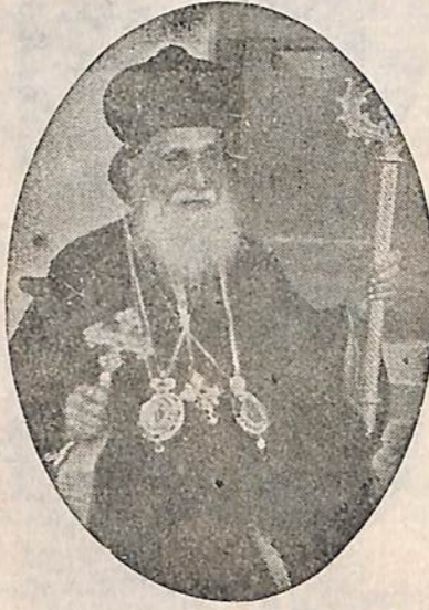
ദേവലോകം അമനയിൽ കബറടങ്ങിയിരിക്കുന്ന പ. ഐഗൻ പ്രഥമൻ ബാവാ. ഓർമ്മ. ഡിസംബർ 8.